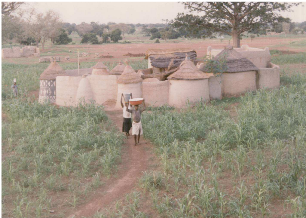
(Une petite concession ninkārsɩ yire )

La cellule familiale est la demeure yire d'un petit groupe d'une proche parenté paternelle. Dans le cas simple il s'agit du père (chef de famille yidāana ) et de ses fils avec leurs épouses et leurs enfants.