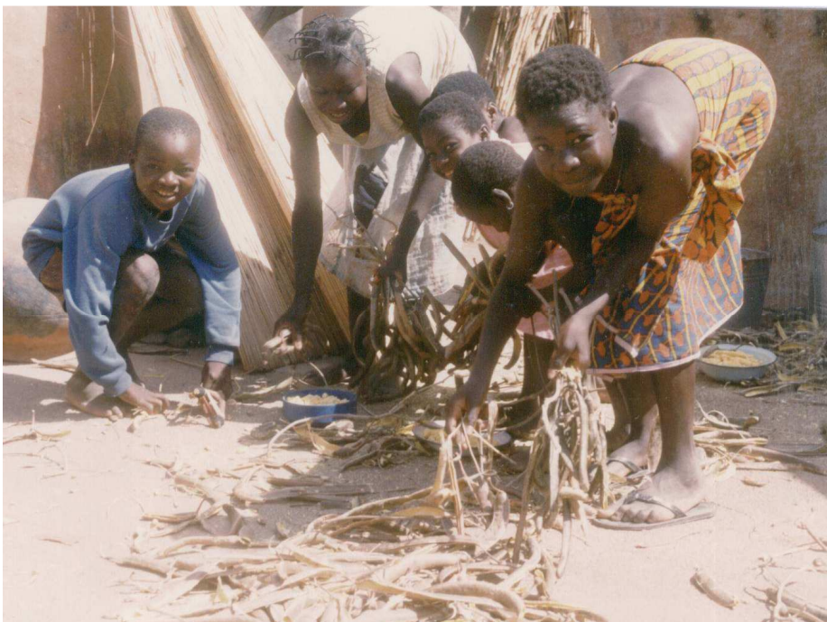
(Des enfants en train de ramasser des cosses de néré)

Pour les deux parents les enfants sont une source de fierté et de satisfaction.